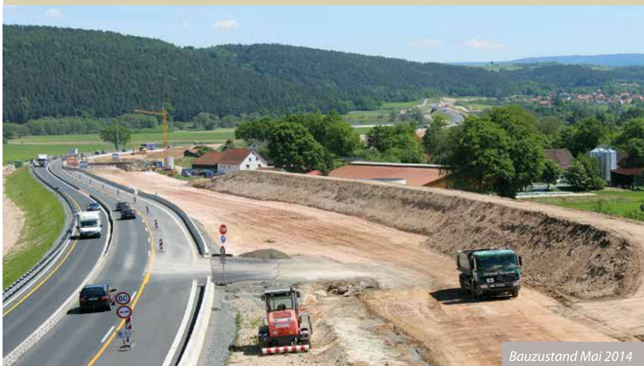
Bauzustand Mai 2014

Die Kosten in Höhe von 52 Millionen Euro werden vom Bund getragen.